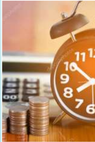
График платежей по договору меняется, поэтому заемщику необходимо направить новый график платежей.